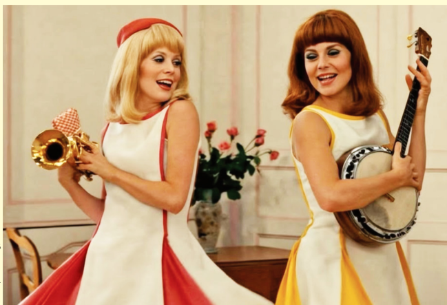
Les Demoiselles de Rochefort